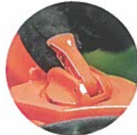
CS-4010 : Bouchons de réservoir à ouverture sans outils.